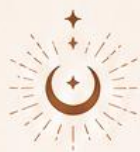
Tableau d'évaluation de votre Dosha